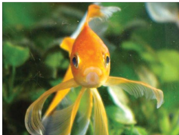
A kormányrendelet a díszhalak nyugalmát is védi