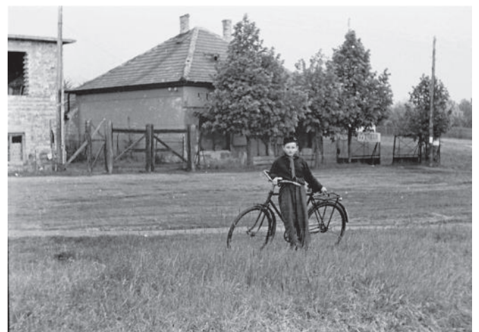
Jelen és múlt ugyanott. Az 1962 körül készült felvételen a „Fűszer Csemege” bolt és a „TÜKER” telep látható. (A TÜKER-ben tűzifát, szenet és építőanyagot lehetett kapni.)