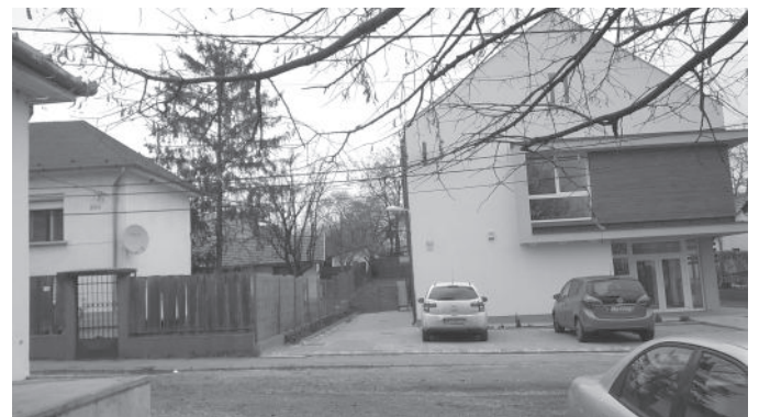
Egészségkert a „Nagyközért” helyén.

Az októberi testületi ülésen döntöttek a városvezetők a régi épület bontásáról is, ami tavaszra várható. Így az elképzelések szerint a leendő főtér rekonstrukciója nem két, hanem egy ütemben fog megtörténni, így a Kőkereszt és a Toldi utca közötti szakasz egyszerre újulhat meg. Közben a Platánfa sor elején megkezdődött a Katolikus kápolna, közösségi ház építésének előkészülete is, így valóban van remény arra, hogy Rákoskert jövőre a legszebb központtal büszkélkedő városrész lehessen.