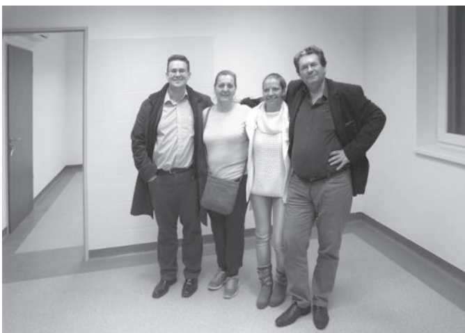
Orvosok és asszisztenseik első látogatása jövőendő munkahelyükön.