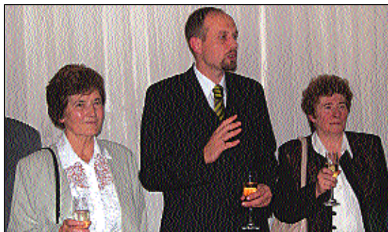
Az ünnepeltek a polgármesterrel