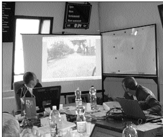
Virág Mihály képekkkel illusztrálta a bitumennel permeztett utak hibáit

A testület egyhangú szavazattal úgy döntött, nem támogatja a Külső kerületi körút, Flór Ferenc utca-Pesti út közötti szakasza által érintett területek Fővárosi Szabá-