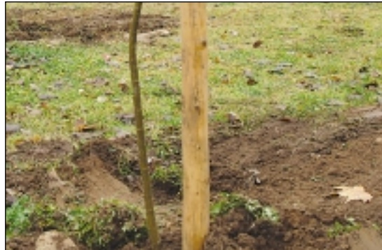
A most csenevésznek tűnő csemeték várostűrő, alacsony vízigényű fákká cseperednek

kormányzattól nemigen várható, hogy a kezelésben álló területeken ültessen és gondozza a fasorokat. Az előrege-