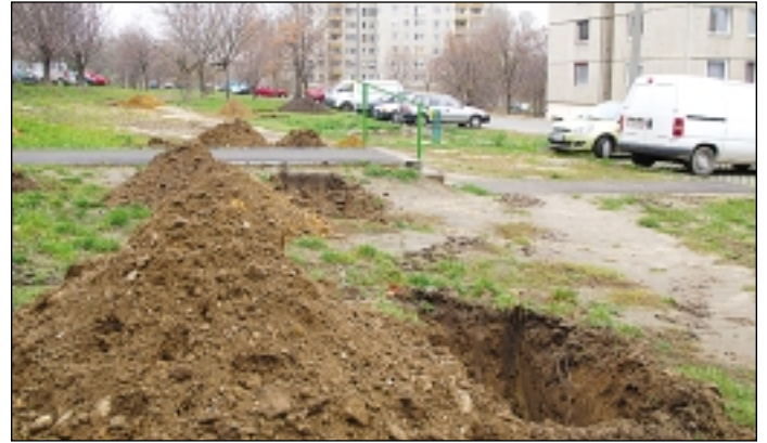
A facsemeték helyének kijelölése után munkagéppel ásták ki az ültetőgödört

den városrészben. Idén elsősorban a rákoskeresztúri lakótelepeken és a főutak mentén pó-