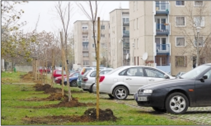
Az Újtek utcai panelrengeteg tavasszal zölddebb lesz

November végéig tartanak a munkák kerületszerte