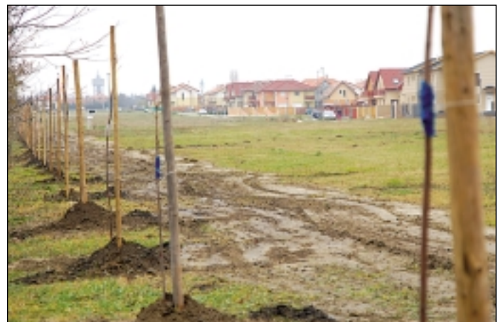
A Helikopter lakóparkot fasor választja el a forgalmas főúttól