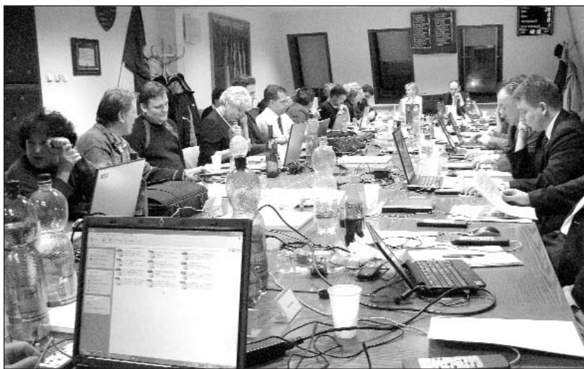
Több mint harminc napirendi pontot tárgyalta meg a testület

taellenességgel magyarázta a Fideszt támogató ligeti voksokat. Hangsúlyozta, hogy Rákosligeten megfontolt, tudatos szavazók élnek, akik nem vevők a populizmusra, demagógiára, nem valami ellen, hanem valami mellett szavaznak.