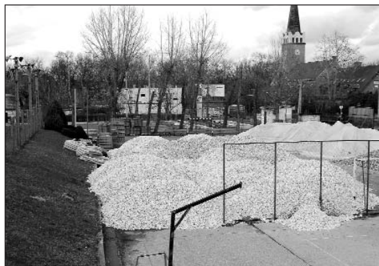
A Bakancsos utcai sporttelepen is megkezdtek az építkezést

lyák műszaki ellenőrzését pályázat útján kiválasztott szakemberek végzik. A csapadékelvezetés kardinális kérdés ezeknél a pályáknál, amelyet ún. draincsövekkel oldanak meg,