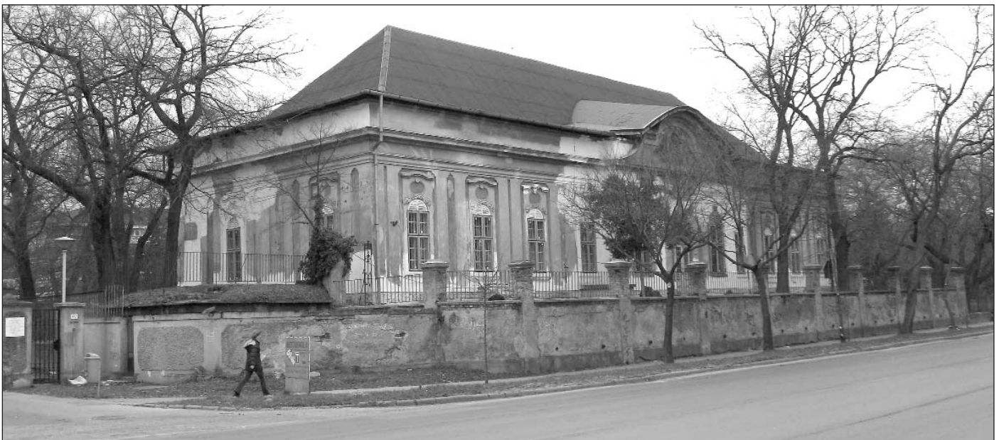
A Podmaniczky-Vigyázó-kastélyról is tárgyalt a testület