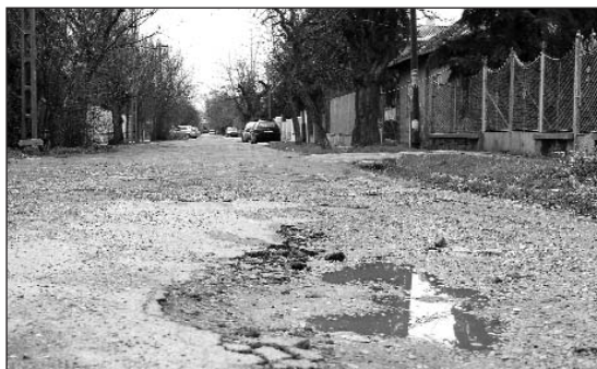
A III. utcából is eltűnnek majd a kátyúk

Rákosmente város-vezetése a 17 EXP-RESSZ útépítési program részeként saját forrásból és a Közép-Magyarországi Operatív Program keretében meghirdetett „Belterületi utak fejlesztése” című (KMOP-2007-2.1.1/B-2007-0054 számú) uniós pályázaton elnyert 475 millió forint támogatás felhasználásával 2009 tavaszán megépített a mellékelt táblázatban szereplő utcákat.