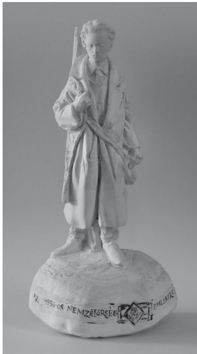
Az emlékmű gipszmakettje